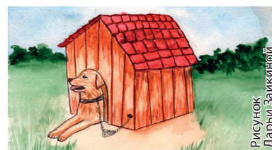
Рисунок Дарьи Заикиной