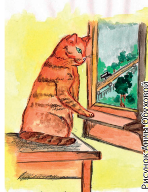
Рисунок Анны Обуховой