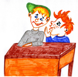
Рисунок Анны Обуховой

- А потому что неизвестно, кто из него вылупится - петух или курица, - пояснил свой ответ Вася.