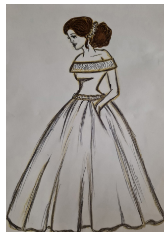
Рисунок Анны Обуховой

Прическа также важный элемент образа на выпускной. Низкий, высокий, классический, растрепанный — выбирайте изысканный пучок по вкусу! Прически, предполагающие убранные вверх волосы, всегда смотрятся изящно. Локоны уже несколько лет в тренде и считаются самой востребованной лёгкой летней укладкой. Сейчас в моде естественность. Идеально подойдет текстурный пучок, гладкий голливудский хвост или любой вид локонов. Обязательно образ надо дополнить аксессуарами! Подойдет что-то не тяжелое, чтобы прекрасный вечер, не перешел в постоянные мысли о боли.