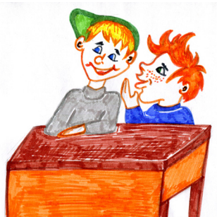
Рисунок Анны Обуховой

- Дедушка! — сразу ответил Вася Лавочкин.