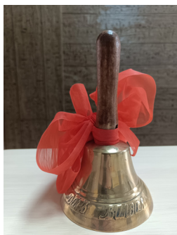
Наш корр., фото Ольги КОЛЬЦОВОЙ

Этот колокольчик стал хорошим дополнением к уже имеющемуся в школе колокольчику, и теперь есть возможность устраивать колокольный перезвон в дни начала и окончания учебного года, что будет и на этот раз 22 мая.