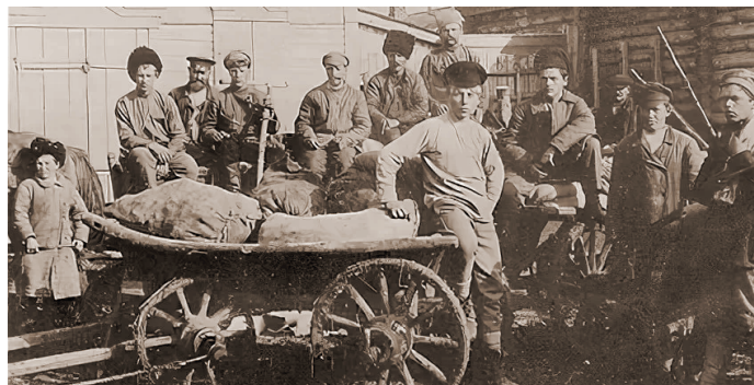
Трудное время коллективизации.