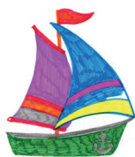
Рис. Анны Обуховой