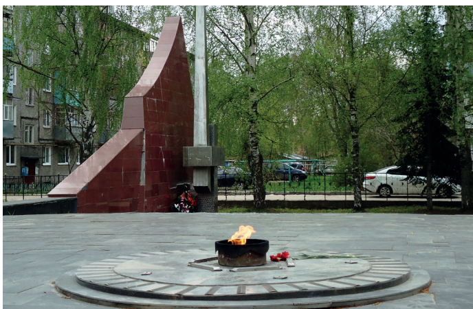
Заволжье. Сквер Победы. Вечный огонь.