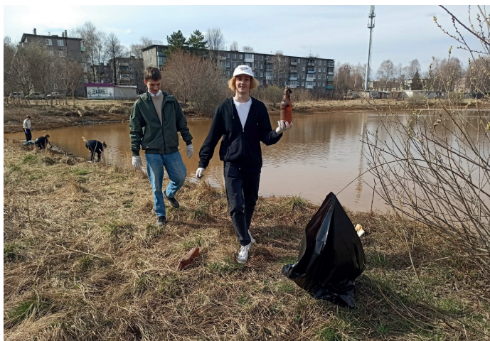
По информации в соцсетях волонтерского объединения «Школа добра»

Мы, волонтеры, призываем каждого школьника и взрослого бережно относиться к природе.